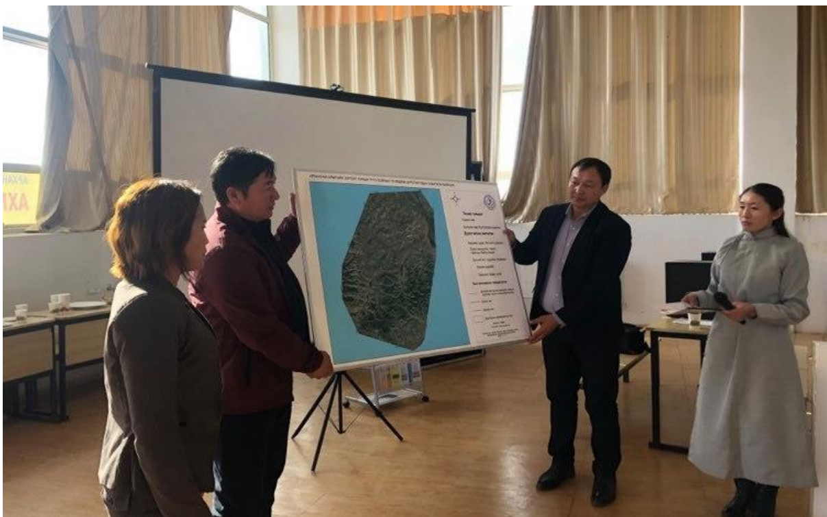
Зураг 4. Судалгааны ажлын тайлан болон бусад материалуудыг хүлээлгэн өгч буй байдал.