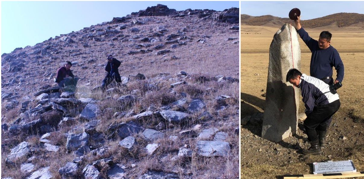
Зураг 1. Түүх, соёлын үл хөдлөх дурсгалын бүртгэн баримтжуулалт, хайгуул судалгааны ажлын явц.

Дэлхийн Өв-Орхоны Хөндийн Соёлын Дурсгалт Газрын хамгаалалтын захиргаа, Архангай аймгийн Хотонт сумын ЗДТГ, Соёлын төвтэй хамтран 2019 оны 10-р сарын 16-ноос 10-р сарын 20-ны хооронд Хотонт сумын нутаг дахь түүх, соёлын үл хөдлөх дурсгалуудын мониторинг тандан болон археологийн хайгуул судалгаа явуулж, Монгол улсын түүх, соёлын үл хөдлөх дурсгалт зүйлийн бүртгэлийн маягтын дагуу бүртгэн баримтжуулалтыг сайжруулахад арга зүйн зөвлөгөө өгч хамтран ажиллаа.