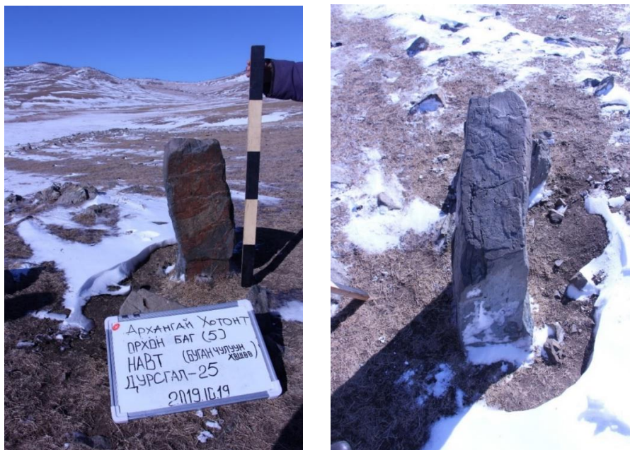
Зураг 2. Шинээр илрүүлсэн Буган чулуун хөшөө (Навт).